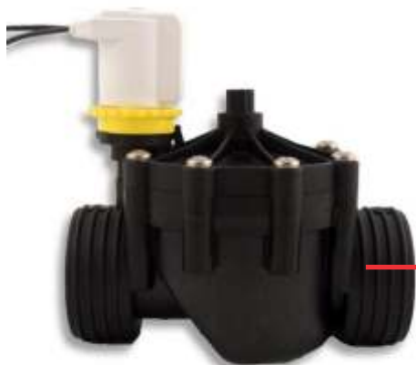
Elektromagnetni ventil 9V